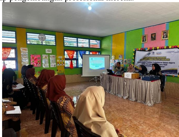
Gambar 1. Pemberian materi pembelajaran Bahasa Inggris

Sesi pendampingan dan monitoring juga menunjukkan dampak yang signifikan, dengan peserta merasa didukung dan termotivasi oleh kunjungan rutin dari tim pelatihan. Mereka menghargai umpan balik konstruktif dan bimbingan yang diberikan, yang membantu mereka mengatasi tantangan yang muncul selama penerapan metode baru. Sesi ini memperkuat rasa percaya diri peserta dalam mengimplementasikan keterampilan yang telah dipelajari. Di sesi pengembangan kurikulum, para peserta bersemangat berkolaborasi dalam merancang kurikulum yang relevan dan kontekstual untuk PAUD di Bulukumba. Diskusi dan workshop tentang pembuatan materi ajar disambut dengan antusiasme, dengan peserta aktif berkontribusi ide-ide kreatif dan berbagi pengalaman mereka. Penutupan kegiatan diakhiri dengan sesi evaluasi yang positif, di mana peserta mengungkapkan kepuasan mereka terhadap hasil pelatihan dan berharap dapat menerapkan pengetahuan baru ini di kelas mereka. Sertifikat partisipasi diserahkan dengan penuh kebanggaan, menandai pencapaian dan komitmen peserta terhadap pengembangan profesional mereka.