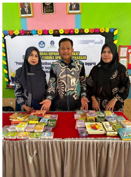
Gambar 2. Penyerahan alat bantu pembelajaran di PAUD

Tim Pengabdian kepada Masyarakat terdiri dari enam anggota: dua dosen dari FKIP Universitas Terbuka Makassar dengan latar belakang Pendidikan Bahasa Inggris, dua orang dari Universitas Khairun dengan latar belakang Akuntansi dan Teknik Informatika, serta dua mahasiswa dari Universitas Terbuka Makassar.