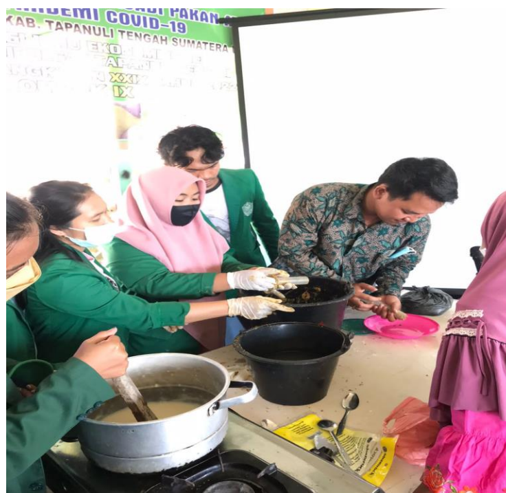
Gambar 4. Proses pengolahan limbah ikan menjadi pakan ayam dengan masyarakat desa jago-jago Kecamatan Badiri, Kabupaten Tapanuli Tengah.