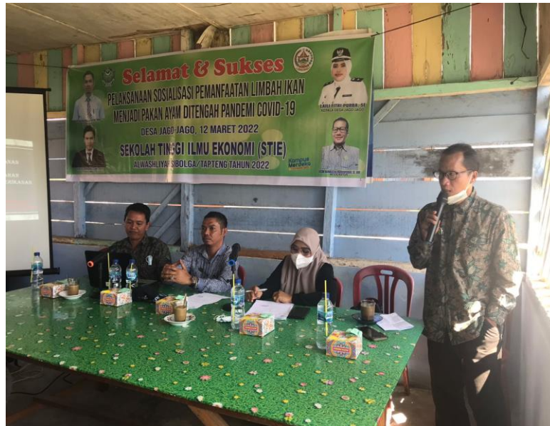
Gambar 3. Moderator dan pemaparan materi tentang covid-19