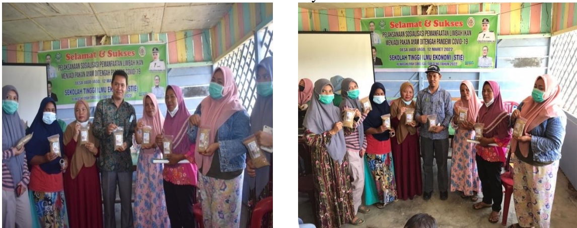
Gambar 6. Foto bersama narasumber dengan masyarakat Desa jago-jago