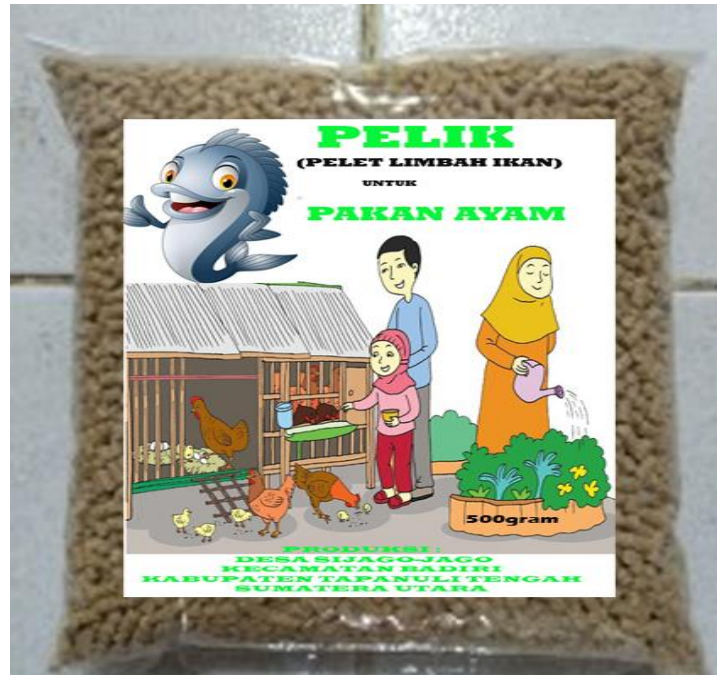
Gambar 5. Hasil Akhir Pakan Ayam.